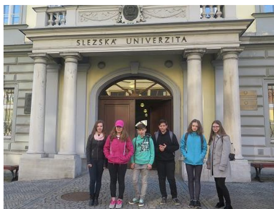
Das ist toll! soutěž v německé jazyce...