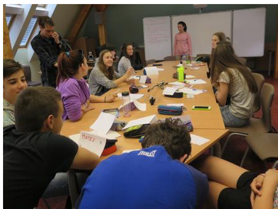
Týden s rodilými mluvčími...