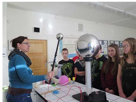
Vyráběli jsme blesky...