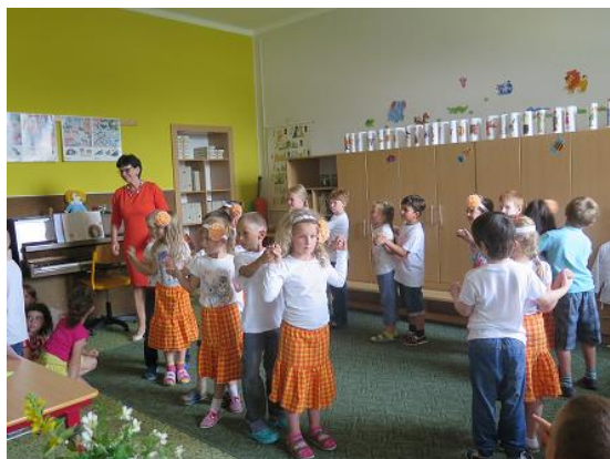
Kabaret u dobré pohody v 1.B...