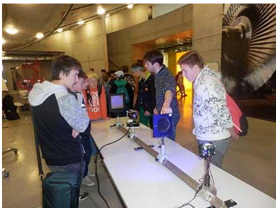
Svět techniky Ostrava...