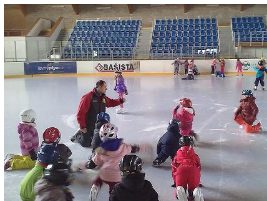
Lekce bruslení pro I. stupeň...