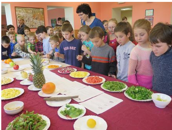
Ochutnávka netradičního ovoce a zeleniny...