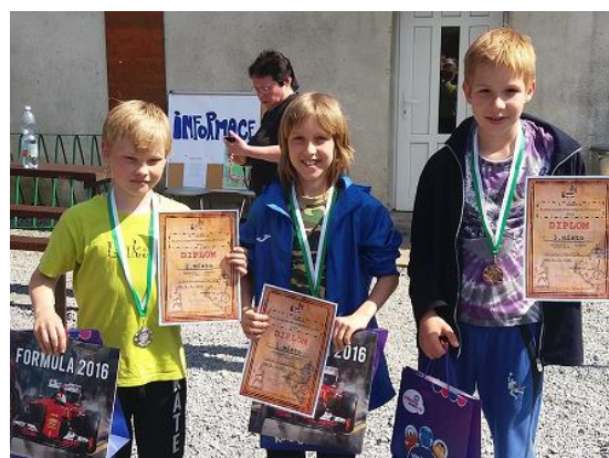
Branný závod Holčovice...