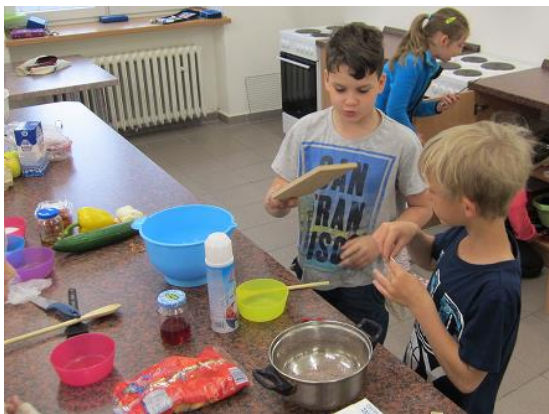
Vaření ve cvičné kuchyňce...