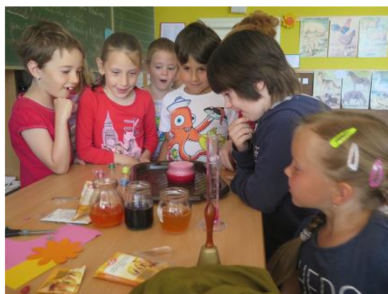
Den vědy pro I. stupeň...