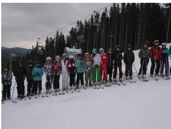
Lyžařský výcvik sedmých tříd...