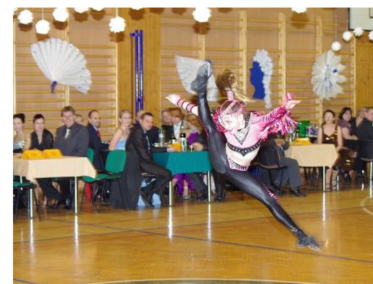
X. společenský ples...