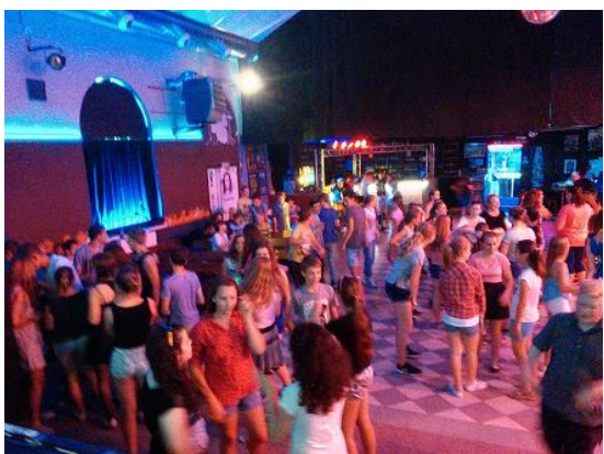
Točili jsme klip v Kofole...