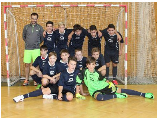
Turnaj ve futsale...