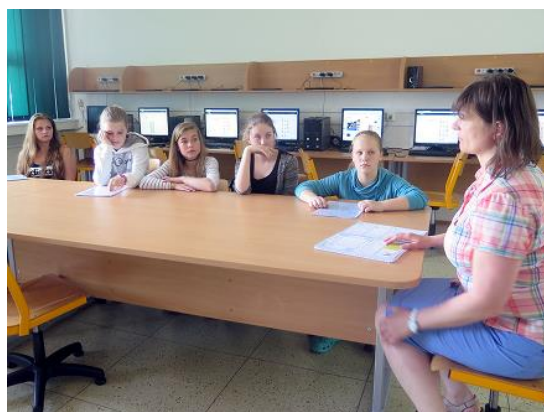
Pilotáž Angličtiny pro matematiku...