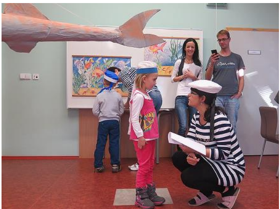
Námořnický zápis do 1. tříd...