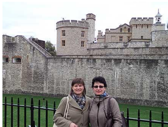
Jazykový kurz v Londýně pro učitele...