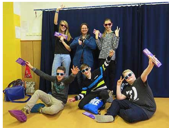
Fyzshow – Prapodivné kapaliny...