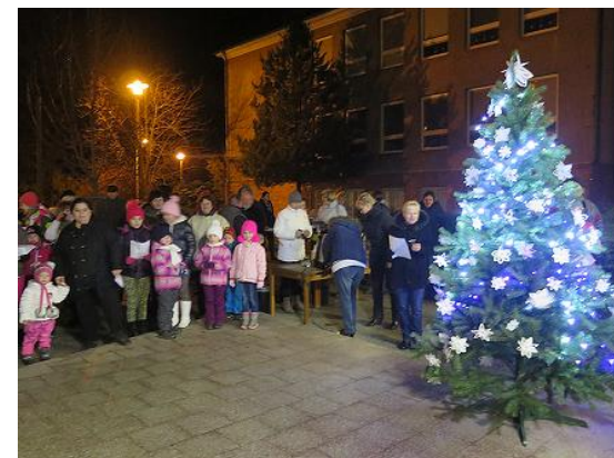
Česko zpívá koledy...