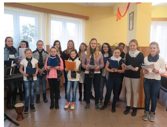
Vystoupení sboru pro seniory...