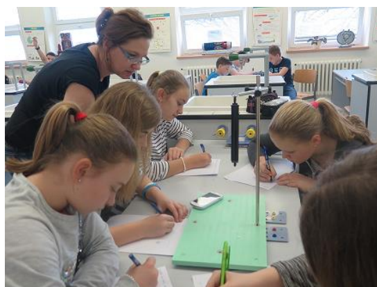
Laboratorní práce z fyziky...