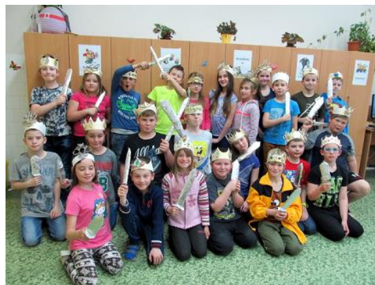
Projekt Karel IV...