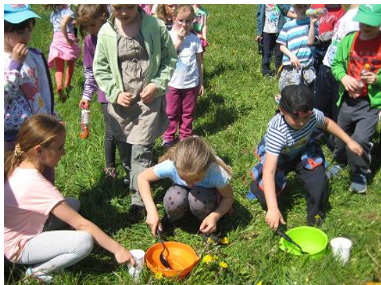
Družináři cestovali strojem času...