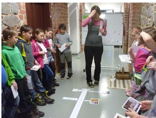
Velikonoce v muzeu...