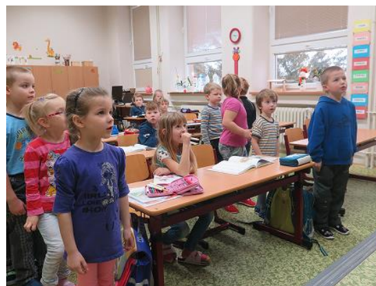
Návštěva dětí z MŠ....