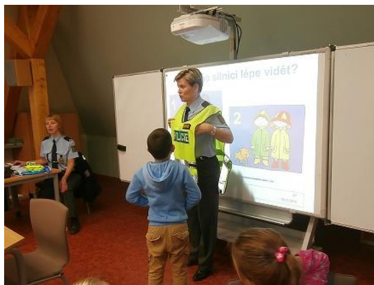
Besedy s Policií...