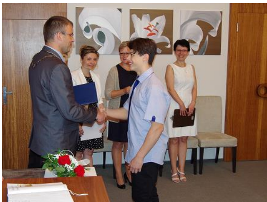
Rozloučení devátáků na MěÚ...