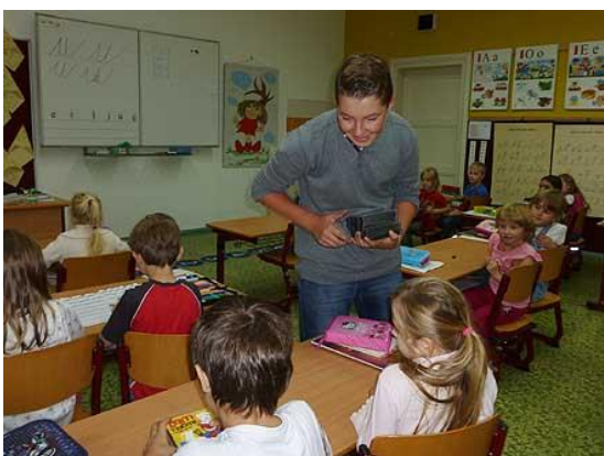
Literární soutěž – Čertovské pohádky...