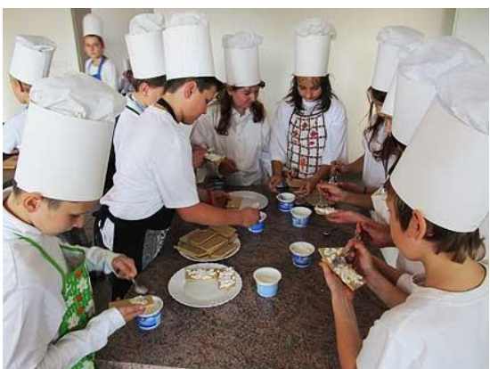
Zdravá svačinka – Knuspíci...