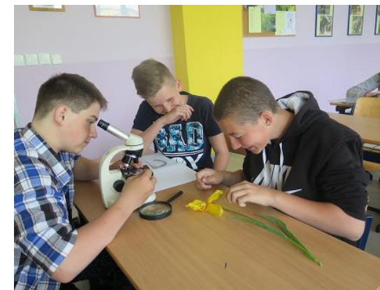
Laboratorní práce v přírodopise...