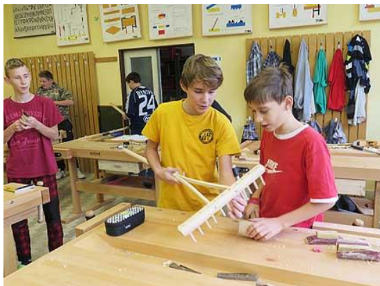
Tvoření v dílnách...