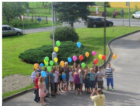
Rozloučení 5. B s nižším stupněm...