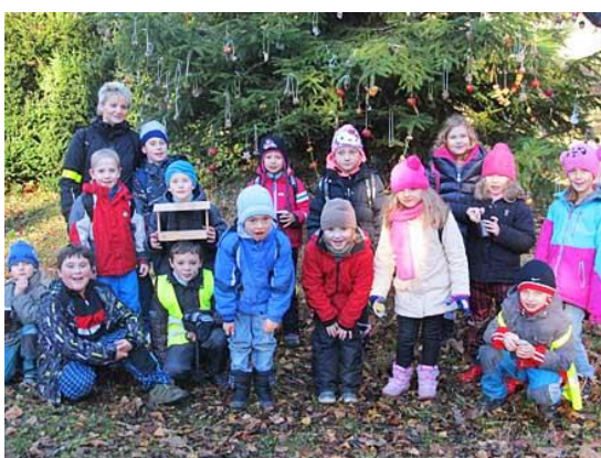
Zdobení vánočního stroměčku...