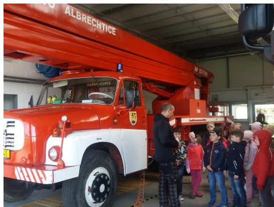
Návštěva hasičské zbrojnice...