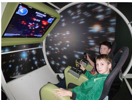
Páťáci v Planetáriu Ostrava...