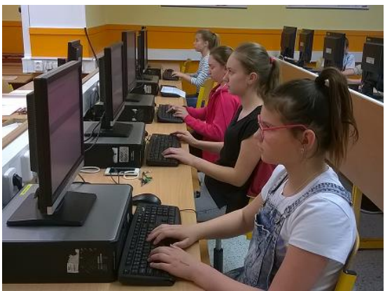
Talentská soutěž ZAV...