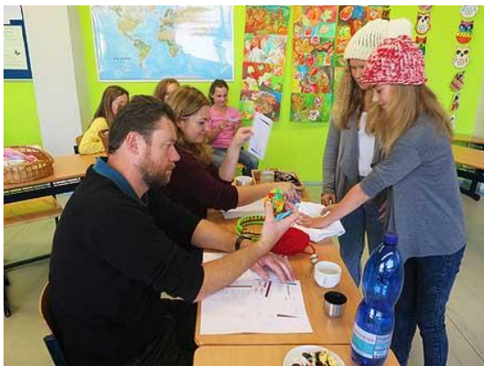
Konkurz na minipodnik...