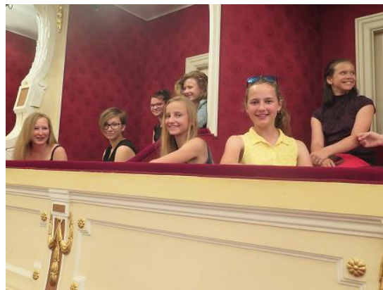
Návštěva divadla v Opavě...