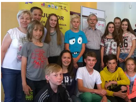
Mistrovství ČR Junior v ZAV