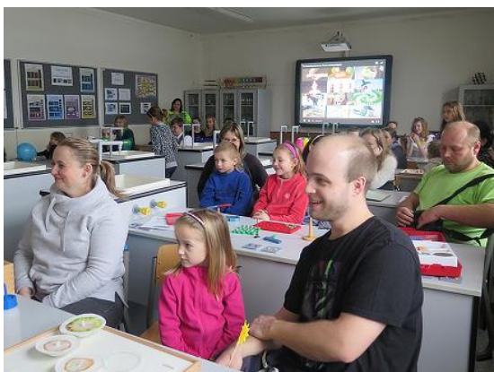
Den otevřených dveří...