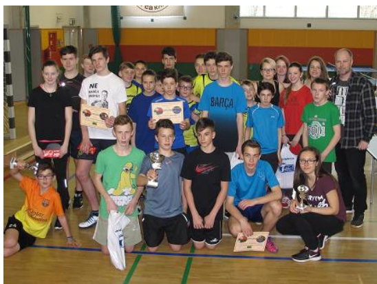
Žákovská liga ve stolním tenisu...