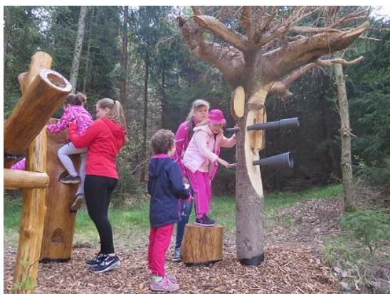
Pomoc při otevření Pohádkové cesty...