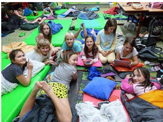
Spaní ve škole...