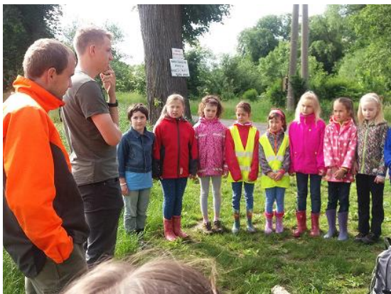
Vycházky s lesními pedagogy...