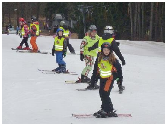
Lyžařský kurz pro I. stupeň...