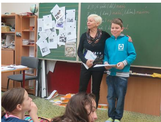
Pangea – matematická soutěž...