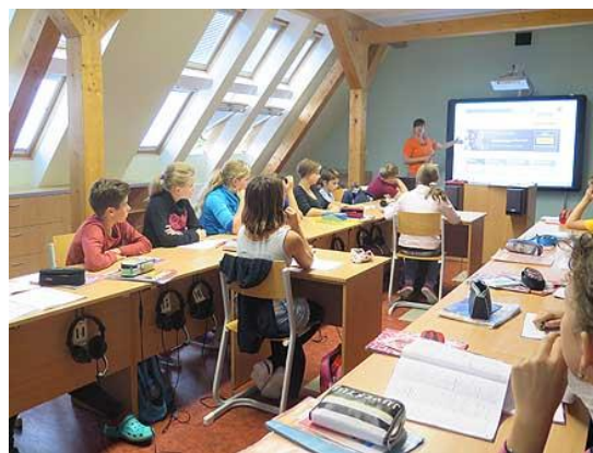
eTwinning v hodinách angličtiny...