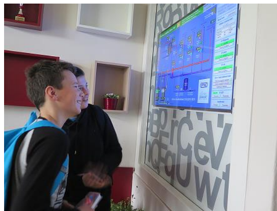
Infotabule u hlavního vchodu...