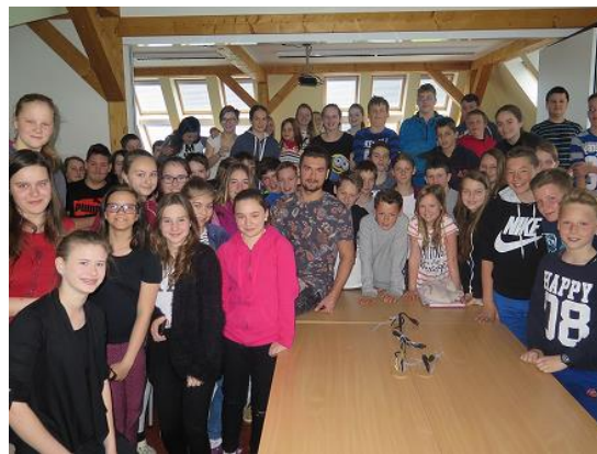
Půl roku s Asiem...