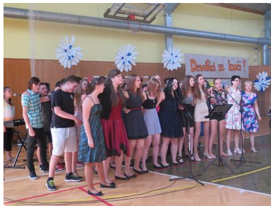
Závěrečný program devátých tříd...