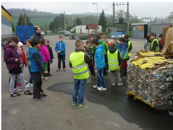
Návštěva sběrného dvora...