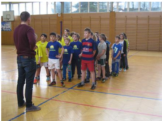
Turnaj družiny ve vybíjené...