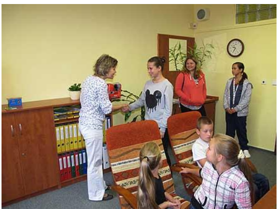
Soutěž o nejlepší foto z prázdnin...