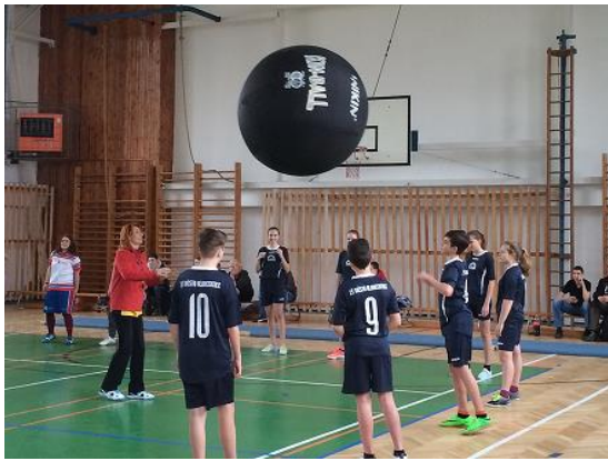
Turnaj v Kinballu...