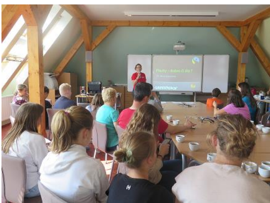
Přednáška Plasty – dobro, či zlo?...